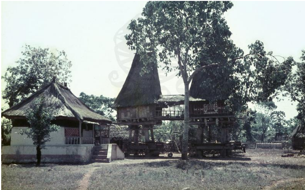
Capa: Postal ilustrado, Timor c. 1966